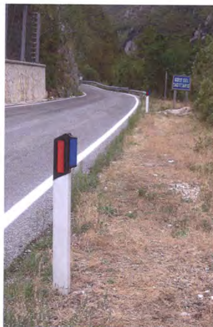
esempi di dispositivi installati nella Riserva e Oasi WWF "Gole del Sagittario"

Siamo a disposizione per condividere con gli Enti presenti nel territorio l'esperienza maturata e per definire in maniera congiunta e globale i possibili ulteriori interventi da realizzare nel nostro territorio.